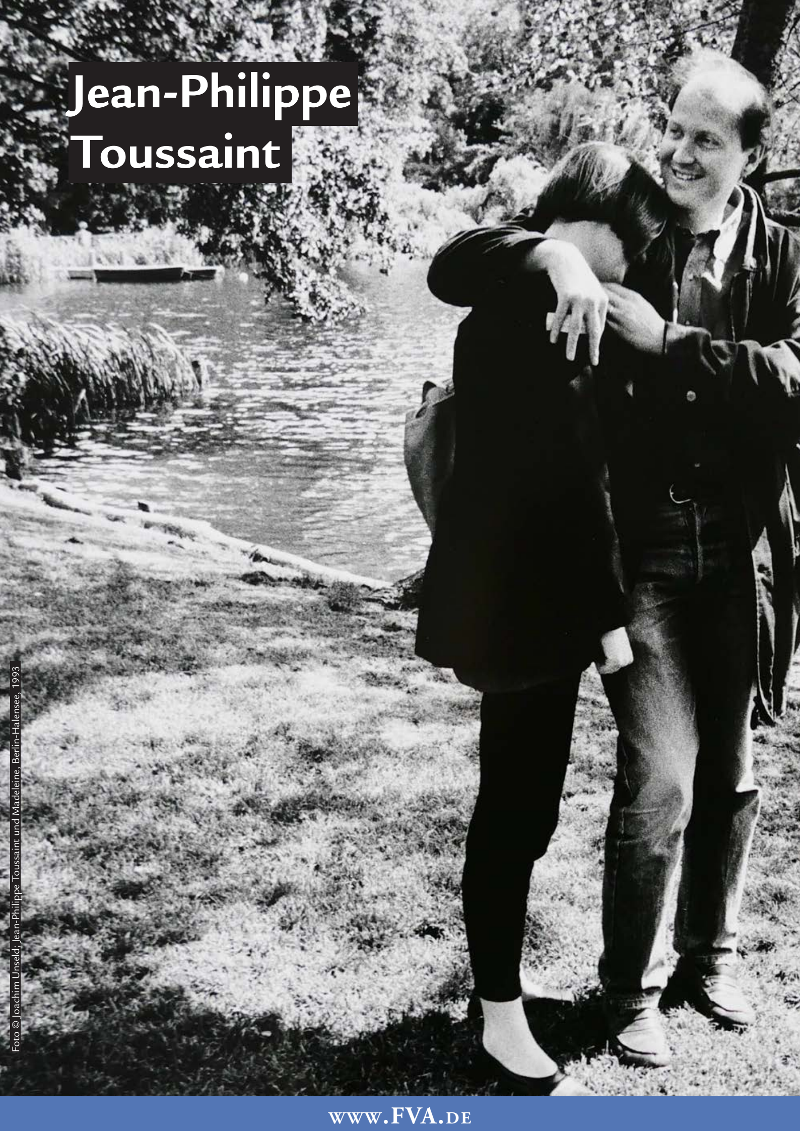
Jean-Philippe Toussaint und Madeleine, Berlin-Halensee, 1993