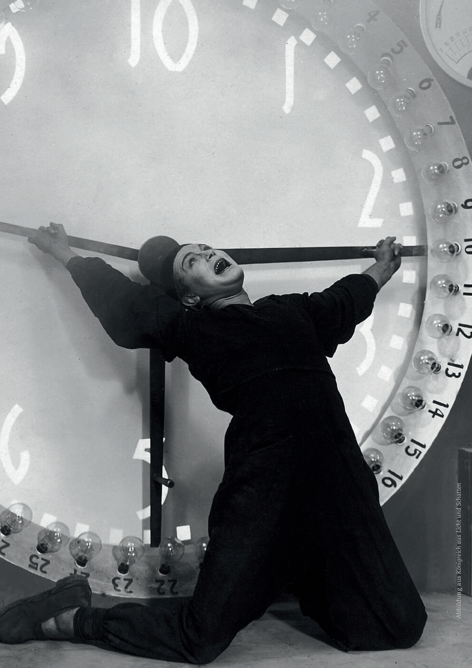
Abbildung aus Königreich aus Licht und Schatten